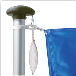
Mastkopf mit Gewicht

Fahnenmast konisch, innenliegende Hissvorrichtung