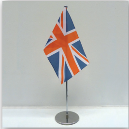
Tischflagge mit Schraubfuß, verchromt

Umlaufend gesäumt oder gekettelt, mit Schnürchen zum Anbinden