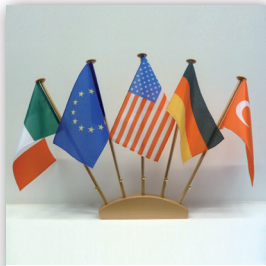
Flaggenigel, 5-fach, mit Steckfuß, Holz