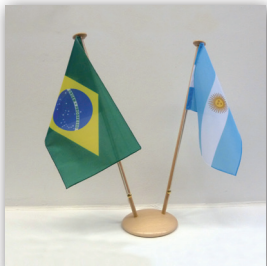
Flaggenigel, 2-fach, mit Steckfuß, Holz